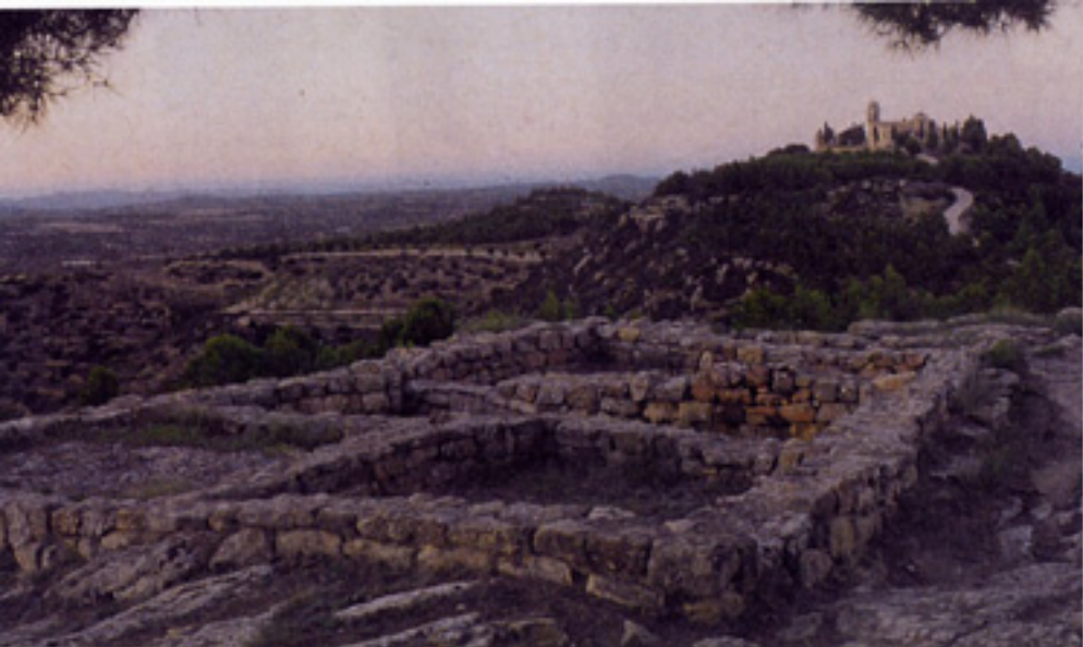
Poblado de San Antonio , en Calaceite. Al fondo, ermita de San Cristóbal

varios enclaves entre los que destacan Taratrato. El poblado, que fue destruido por un incendio, cuenta con cuarenta viviendas y estaba dedicado principalmente al cultivo de cereales. También sobresale Cascarujo, con una impresionante necrópolis en la que destacan numerosos túmulos, cincuenta de ellos descubiertos el pasado año.